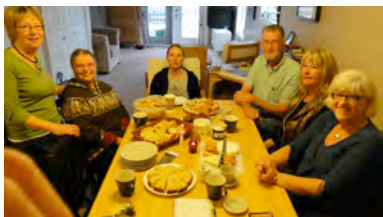
Delar av satellitförsamlingen